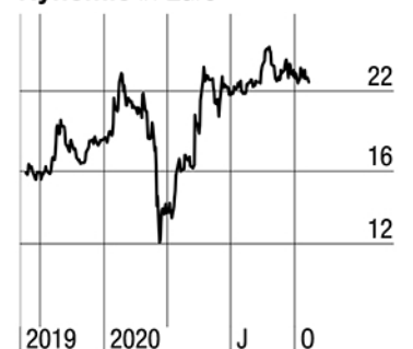
Nynomic in Euro

Offizielle Statements gibt es zwar keine, doch die Wahrscheinlichkeit ist recht groß,